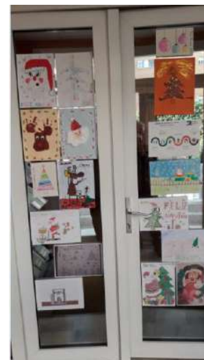
Concurso de Christmas navidades 2020/21