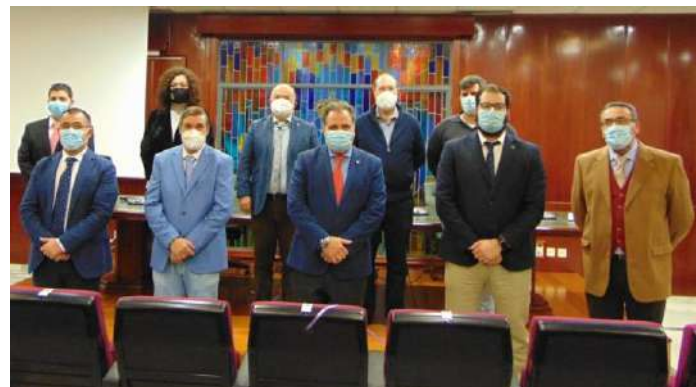
Toma de posesión de nueva Junta de Gobierno 3 de diciembre del 2020