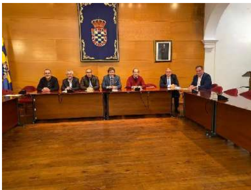
Junta de Gobierno en el Ayuntamiento de Moguer 12 de marzo del 2020