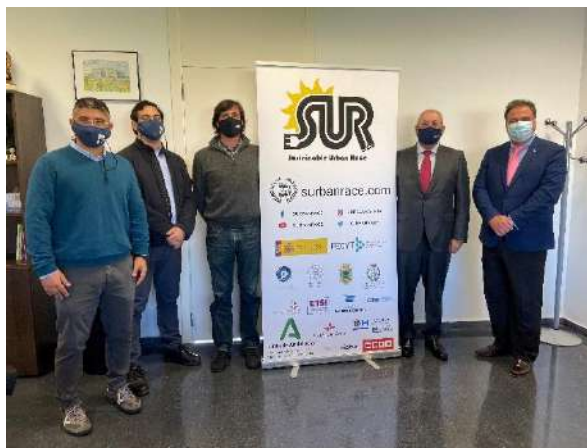
Firma convenio con Surbanrace