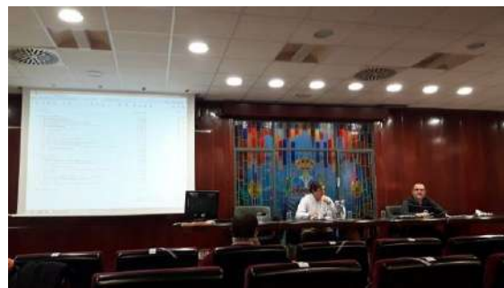
Junta General Ordinaria