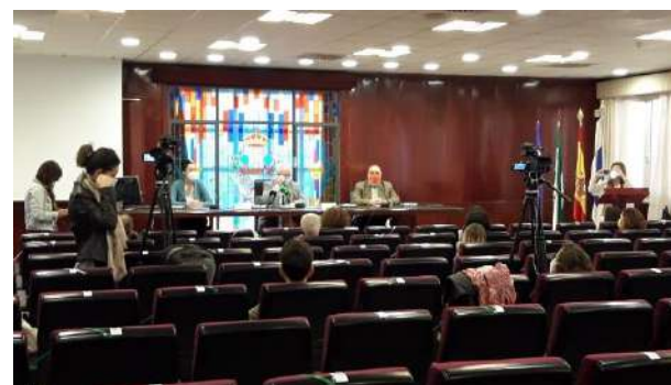
Rueda de prensa sobre el Proyecto CEUS