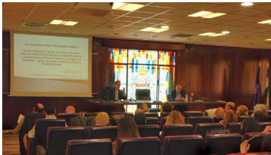
Jornada sobre espectáculos públicos y actividades recreativas en Andalucía