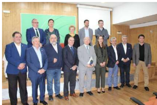
Reconocimiento a la Unión Profesional de la Delegación del Gobierno de Huelva