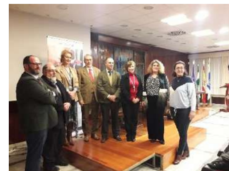
Jornada de Netin Club