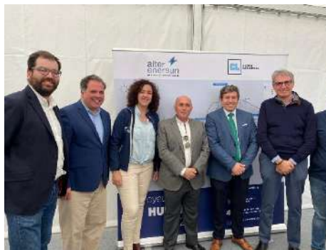
Inauguración de la Planta Solar Fotovoltaica Huelva 2020