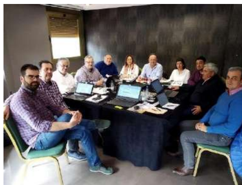
Reunión Ejercicio Libre CACITI