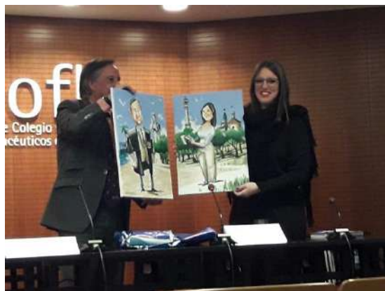
2º día Primeras jornadas gestión Colegios Profesionales