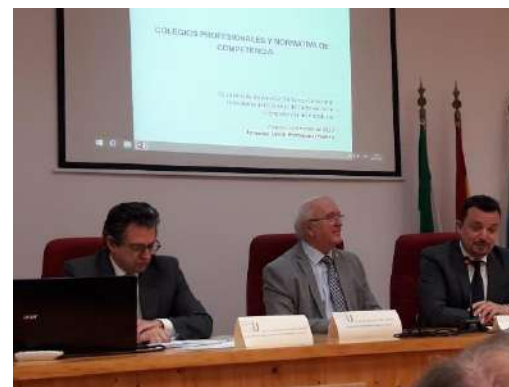
1º día Primeras jornadas gestión Colegios Profesionales