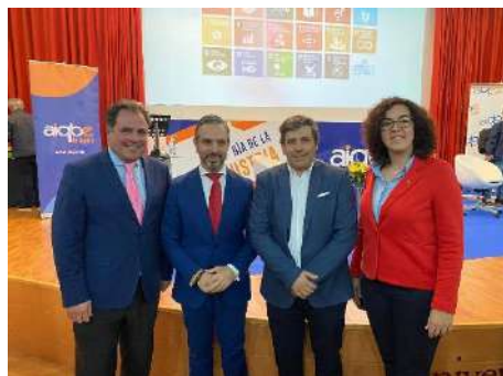
Día de la Industria