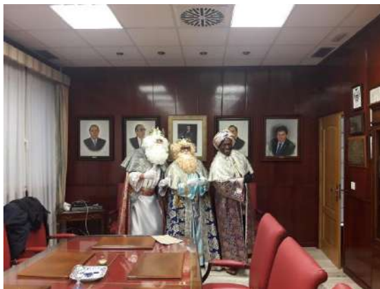
Visita de los Reyes Magos, enero de 2020