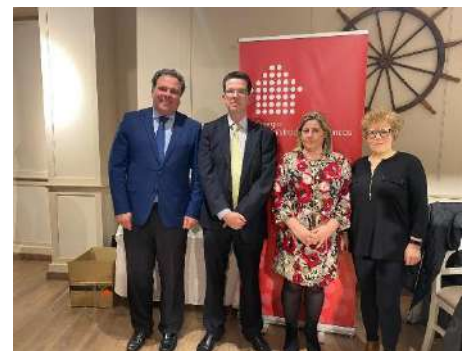
Almuerzo Colegio Administradores de Fincas