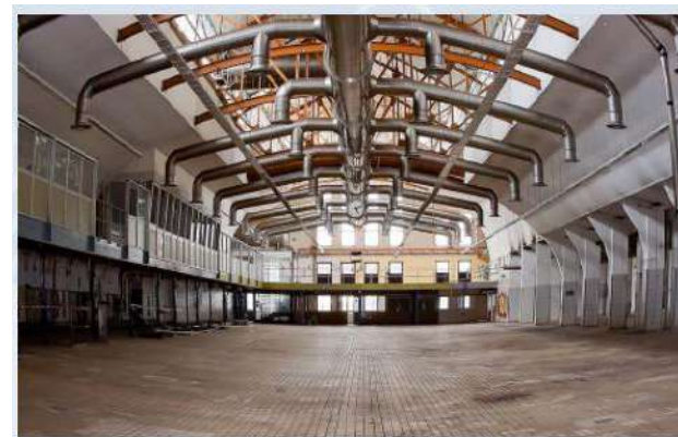
Diseño de sistemas de evacuación de hunos UNE-23585