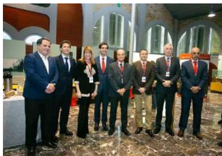
Jornada “Cómo mejorar la competitividad de las empresas a través de una estrategia sostenible”