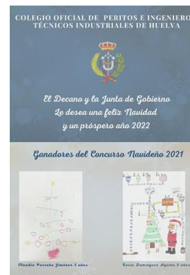
Concurso de Christmas Navidades 2021/22