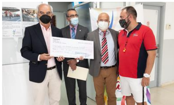
Entrega RSC al CODA