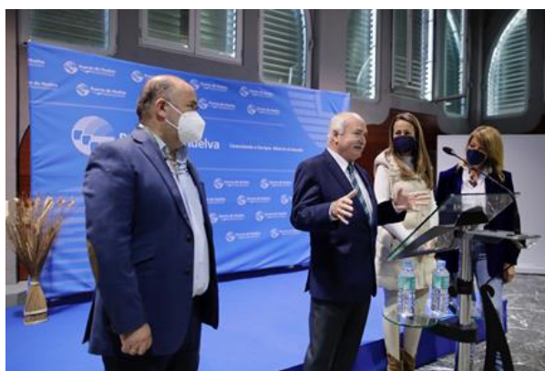
Reunión del CACITI en Huelva