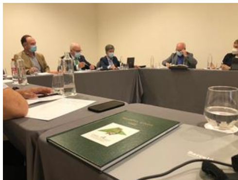
Reunión del CACITI en Granada