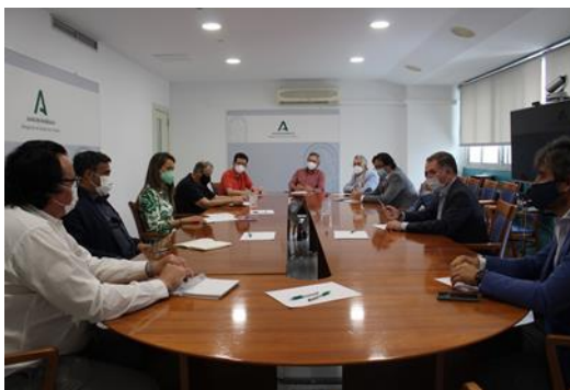
Reunión informativa sobre la nueva Ley de Impulso para la Sostenibilidad del Territorio de Andalucía ( LISTA)