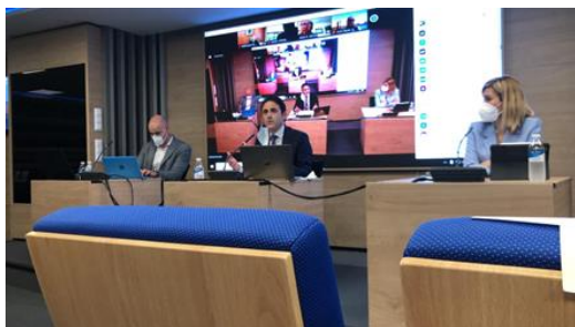
Reunión COGITI junio