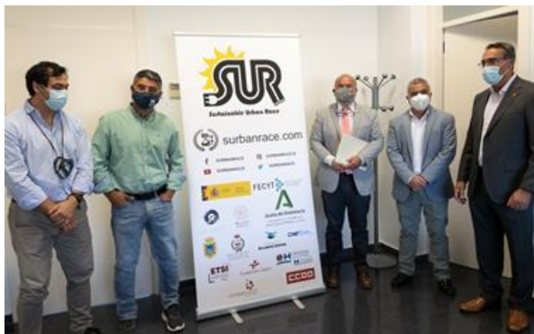
Firma de convenio con Surbanrace