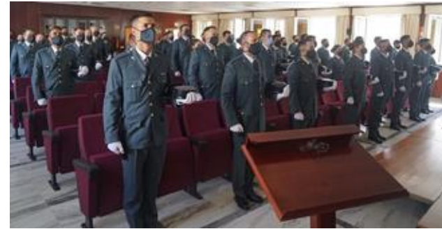
Presentación de los Guardias Civiles de nuevo ingreso