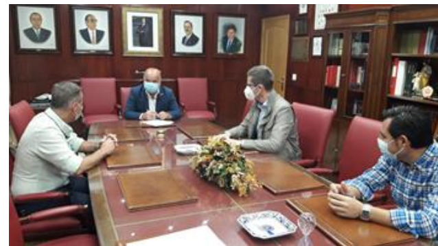
Reunión con Endesa