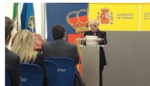
43º aniversario de la Constitución española