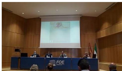
Jornada 'OPORTUNIDADES Y RETOS DE LOS FONDOS NEXTGENERATION'