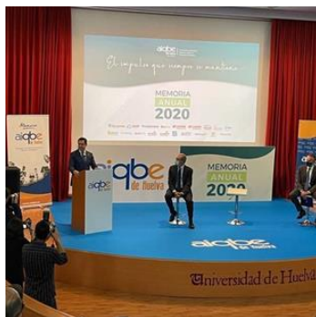
Presentación Memoria 2020 AIQBE