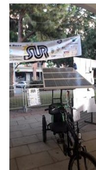
Noche Europea de los Investigadores