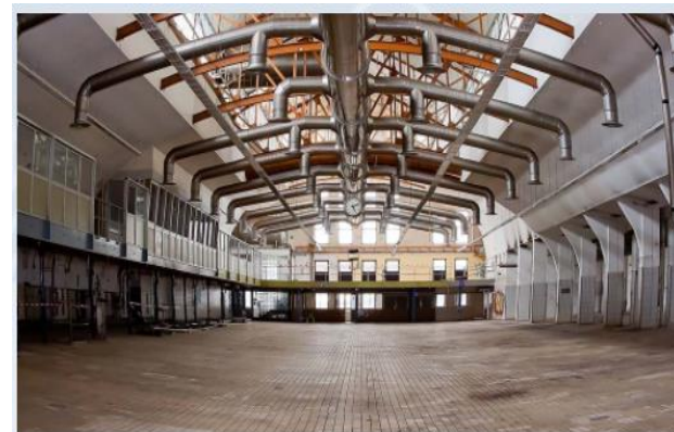
Diseño de sistemas de evacuación de hunos UNE-23585

Especialización en diseño de evacuación de ocupantes en locales, edificios y establecimientos industriales