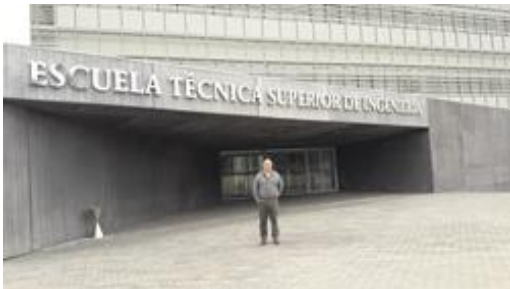
Reunión con Director de la ETSI