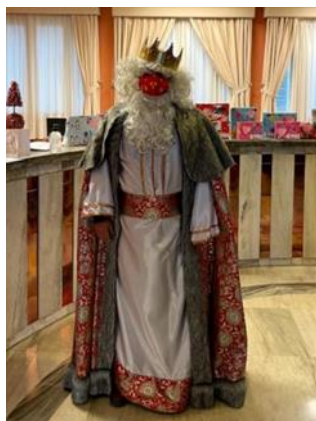
Visita de los Reyes Magos, enero de 2020