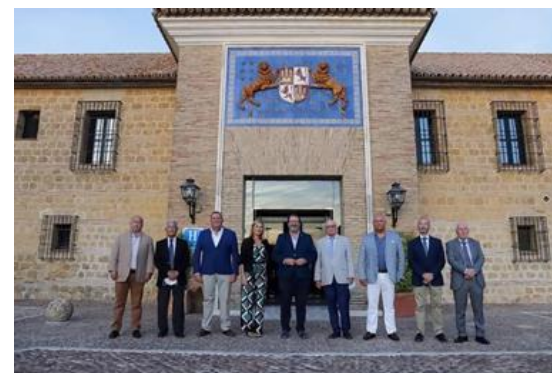
Reunión del CACITI en Carmona (Sevilla)