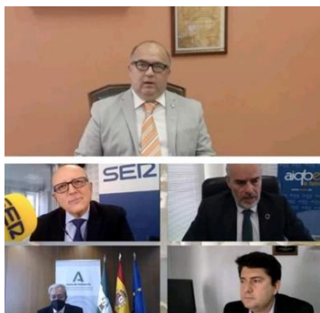
Día de la Industria