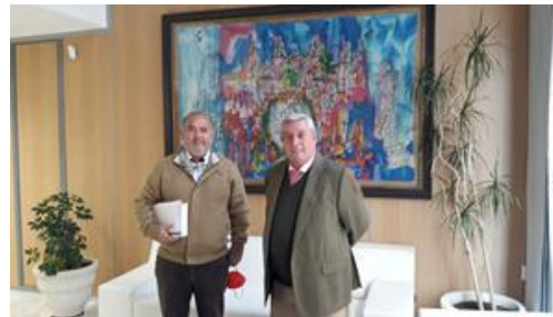
Reunión con el Delegado en Huelva del COIIAOC