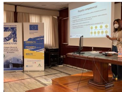
Introducción al nuevo programa HORIZONTE EUROPA 2021-2027