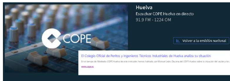
Entrevista al Decano en COPE Huelva (07/04/21)

vocación irrefragable de servicio a la cada colegio, empresa y administración. Queremos estar presentes en el apoyo a las administraciones con una visión estructuralmente técnica. «¿Qué proyectos concretos destacaría?» -Queremos abordar la inclusión de formación general como uno de los pilares de crecimiento del Colegio. Tenemos que aprovechar el potencial técnico que tenemos, el capital humano y la inserción en la sociedad, como elementos fundamentales de desarrollo del mismo. «¿Cómo se está adaptando el trabajo y los servicios del Colegio a la actual situación sanitaria?» -Tenemos nuestro protocolo de actuación como cualquier institución acorde con las directrices de las autoridades sanitarias. Nuestro colegio está adaptado desde hace mucho tiempo a funcionamiento online, por lo que esta pandemia no ha supuesto, en absoluto, ningún contratiempo para nuestros colegiados, como el hecho de haber tenido que trabajar a través del horario presencial de las instalaciones. Al mismo tiempo contamos con espacio suficiente para garantizar el distanciamiento que sea necesario, la presencialidad para cumplir con nuestros funciones en un entorno seguro, tanto para nuestros empleados como para los colegiados.