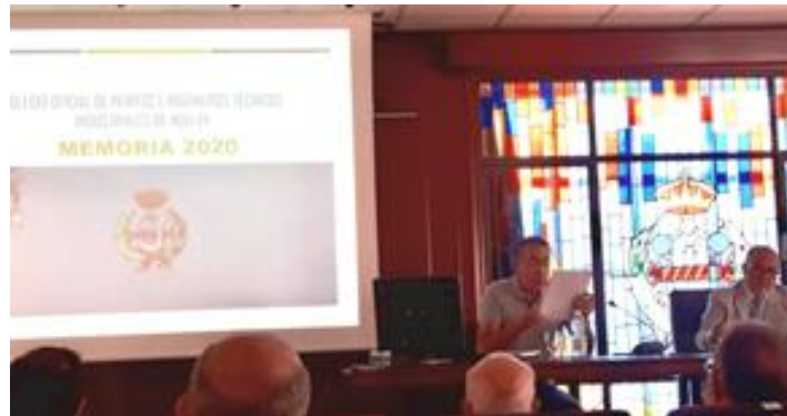
Junta General Ordinaria