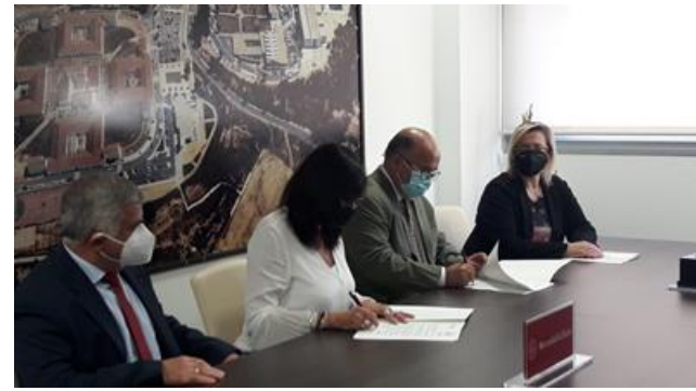
Firma de convenio específico con la UHU