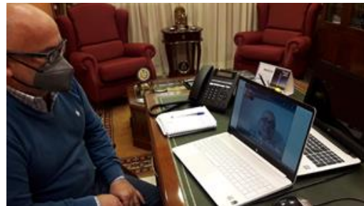
Reunión con el Gerente de AIQBE