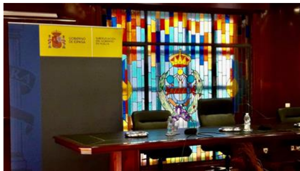
Acto Subdelegación del Gobierno