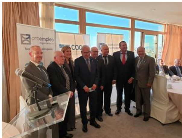
Entrega de Insignia de Oro y Brillantes a D. Alfonso Guerra