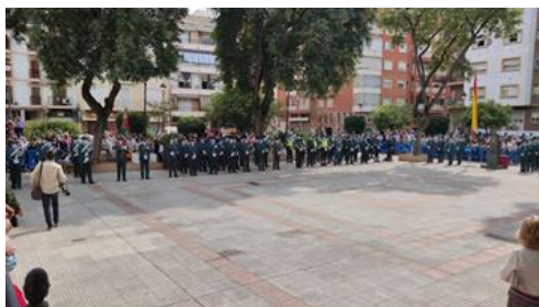
Día de la Guardia Civil