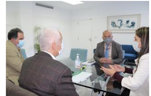
Reunión con la Delegada del Gobierno andaluz en Huelva