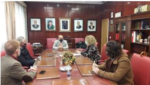
Reunión con el Grupo Municipal PP Ayto. de Huelva