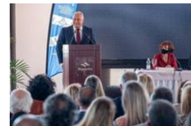
Convención anual Colegio de Cádiz