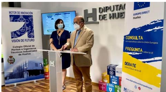
Rueda de prensa presentación curso Introducción al nuevo programa HORIZONTE EUROPA 2021-2027