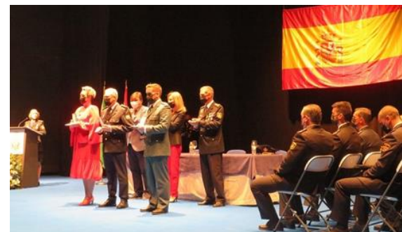
Día de la Policía Nacional