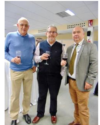
Comida de Navidad