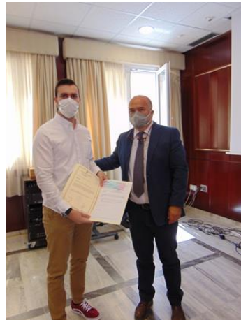
IV Convocatoria premios TFG