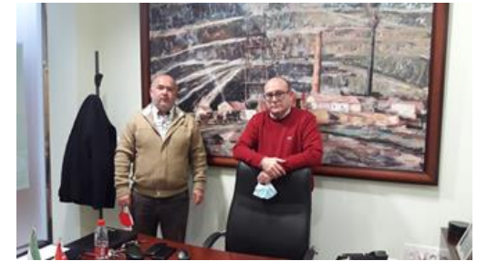
Reunión con el Decano del Colegio de Ingenieros Técnicos de Minas