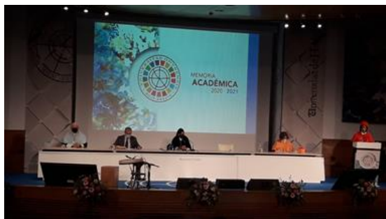
Apertura del curso académico de la UHU