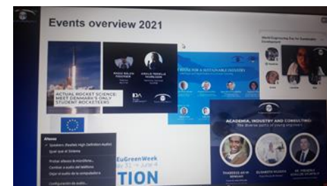
Acto de presentación de la red NETWORK OF EUROPEAN ENGINEERS IN POLITICS (NEEP - EYE)