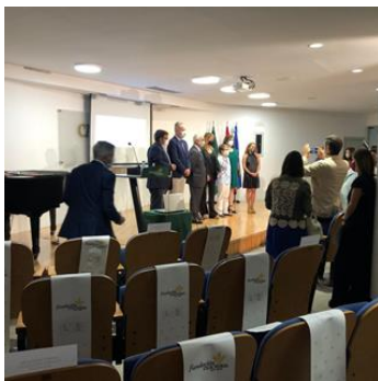
Toma posesión nuevo Decano COAH