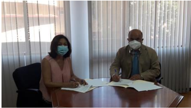
Firma de convenio de prácticas con la UHU