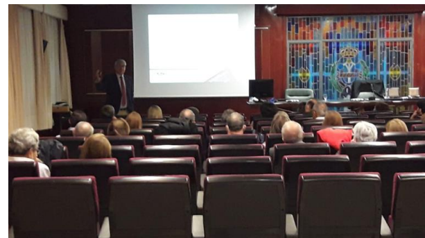
Acto Colegio de Químicos