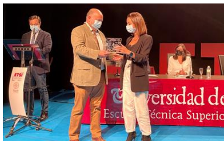
Día de la ETSI