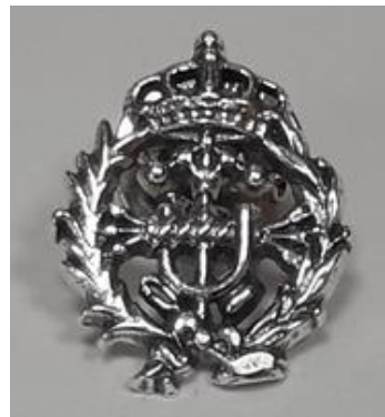
Nuevas insignias realizadas