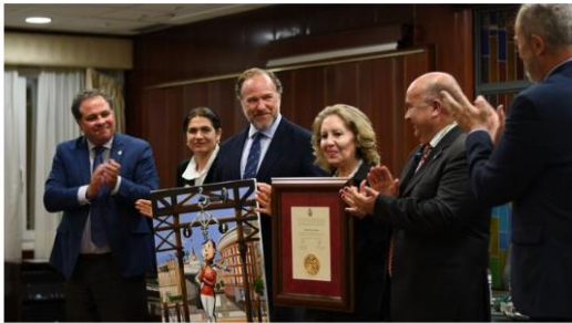
Momento de la entrega de la medalla de oro a la FOE.