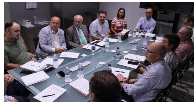
Reunión Mesa de Seguridad Industrial