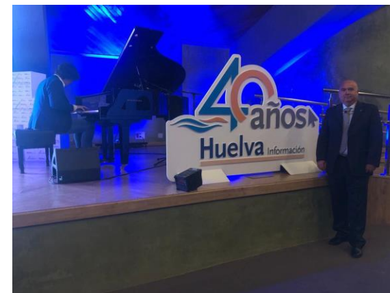
40 aniversario Huelva Información