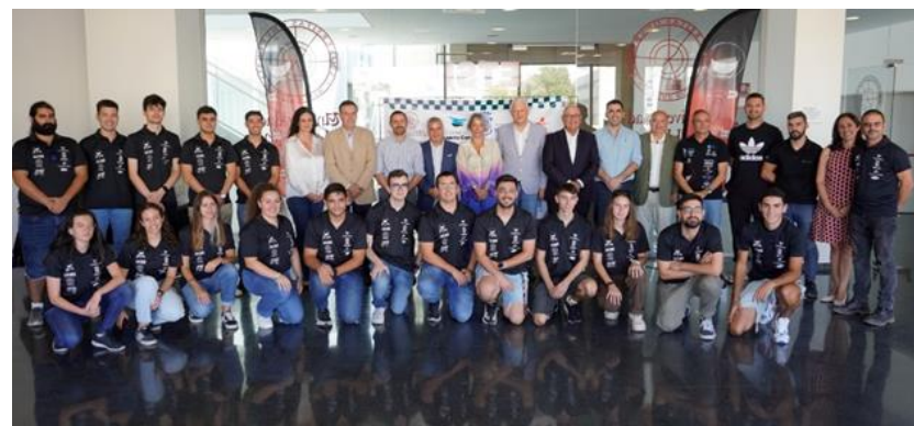
Acto MotoStudent ETSI UHU