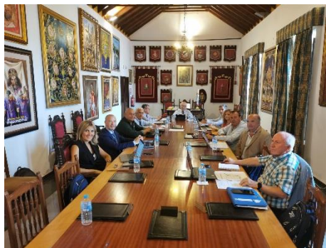
Reunión CACITI en Ayamonte