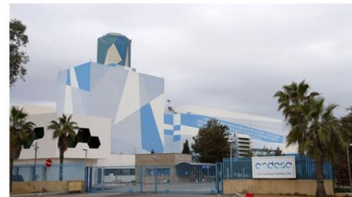
Instalaciones de Endesa. / ALBERTO DOMÍNGUEZ (Huelva)