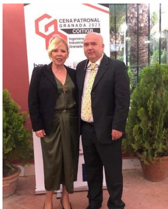
Cena Patronal Colegio Granada