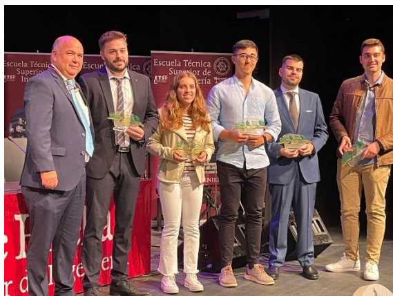
Día de la ETSI