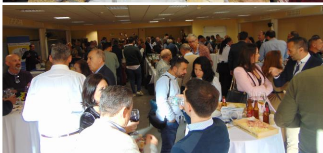
Comida de Navidad