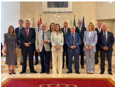
Reunión CACITI en Almería