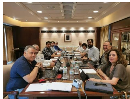
Reunión E.L. en Málaga