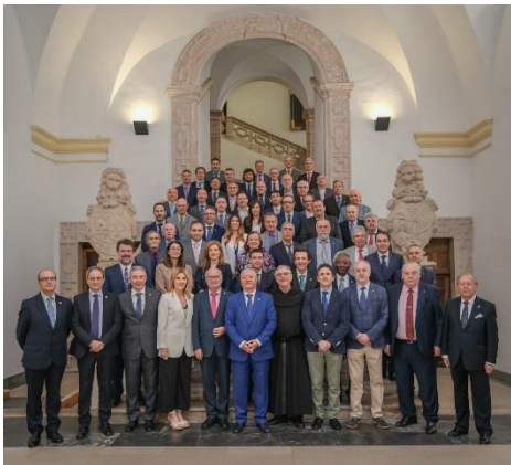
Asamblea General MUPITI