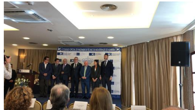
Acto de Hermandad Colegio de Almería