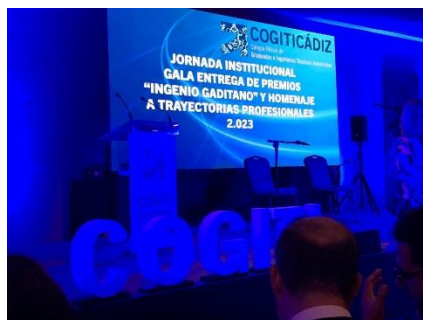
Premios "Ingenio Gaditano" Colegio de Cádiz