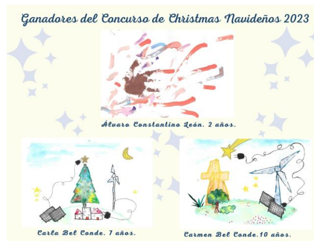
Concurso de Christmas