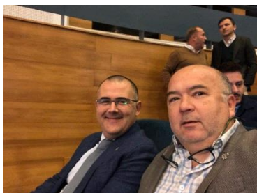
Día de la Industria