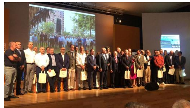
Día de la Profesión Colegio de Málaga