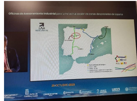
Jornada de presentación de las "INDUSTRIAL ADVISORY OFFICES"