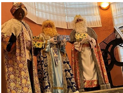
Visita de los Reyes Magos