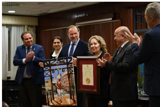
Acto Día del Patrón