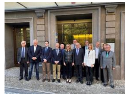
Desayuno de trabajo en Granada con la Consejera de Fomento, Articulación del Territorio y Vivienda