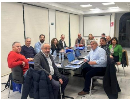
Reunión E.L. en Sevilla