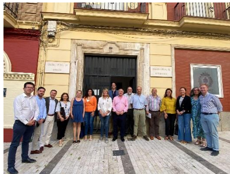
Reuniones de la Unión Profesional de Huelva con candidatos a la alcaldía de Huelva