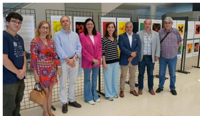
Exposición en la ETSI