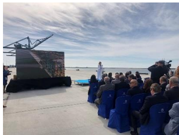
Inauguración Ampliación Norte Del Muelle Sur - Puerto de Huelva