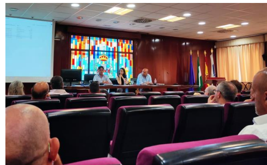
JORNADA NUEVA ORDENANZA DE VELADORES AYTO DE HUELVA