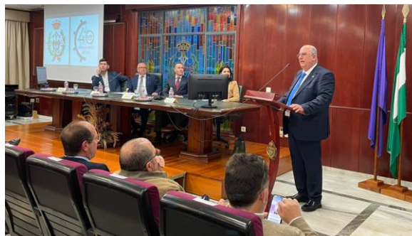
Día del Patrón