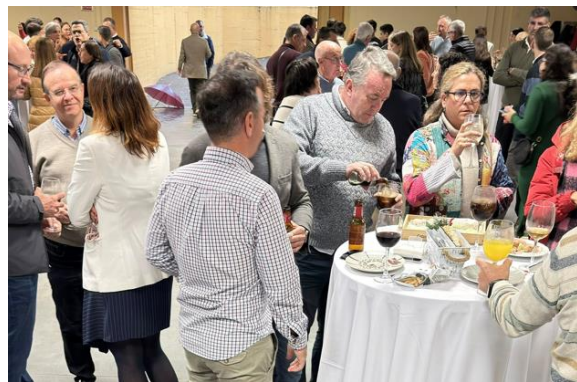
Comida de Navidad del Colegio