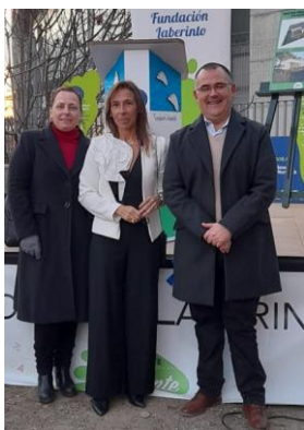
Colocación de la "Primera Piedra" del Centro Polivalente Palante de la Fundación Laberinto