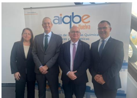
Celebración Día de la Industria