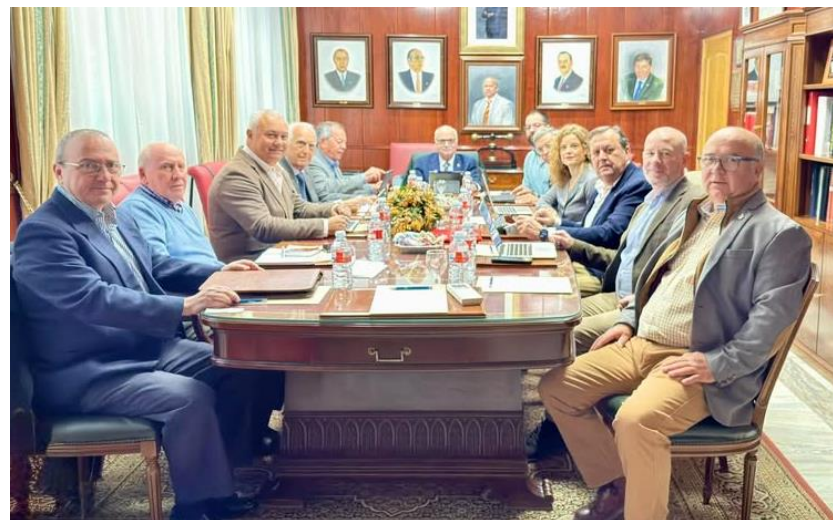
Reunión del CACITI en Huelva