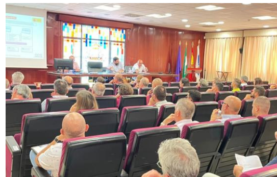
JORNADA SOBRE EL NUEVO RSCIEI