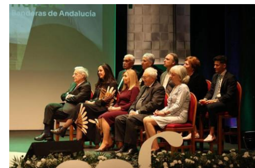
Acto del Día de Andalucía en Huelva