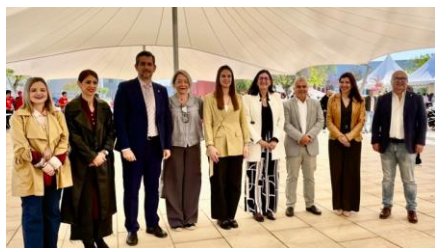
Celebración de la Sustainable Urban Race (SUR 2025)