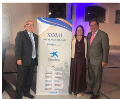
Entrega Premios Onubenses del Año