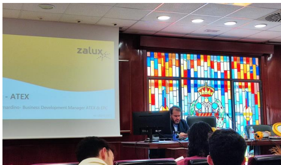
JORNADA TÉCNICA ILUMINACIÓN EN ATMÓSFERAS EXPLOSIVAS (ATEX)