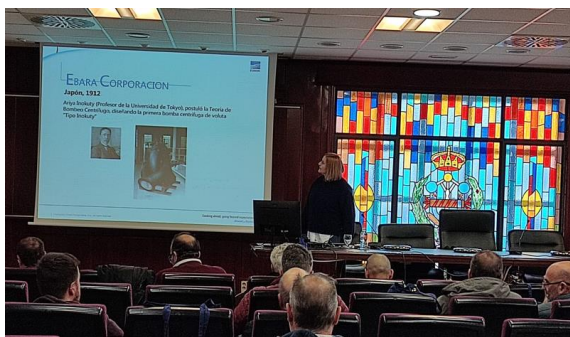
JORNADAS TÉCNICAS EBARA