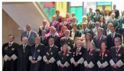
Actos Institucionales del Colegio de Graduados Sociales de Huelva