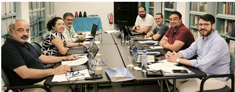
Reunión del Ejercicio Libre del CACITI en Sevilla