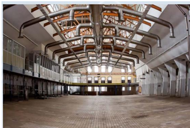
Diseño de sistemas de evacuación de humos UNE-23585