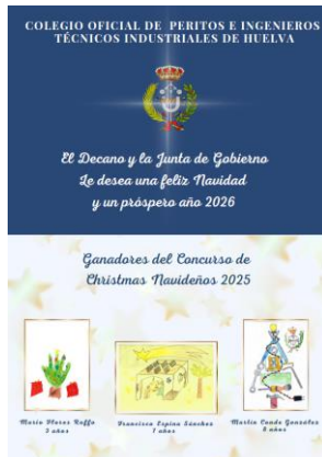
Concurso de Christmas