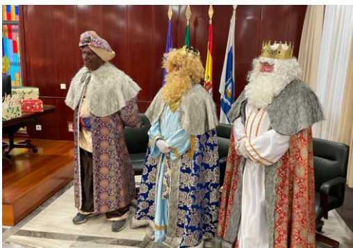
Visita de los Reyes Magos