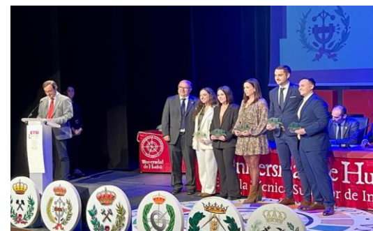
Día de la ETSI