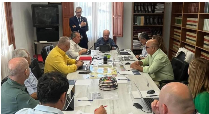
Reunión del CACITI en Almería