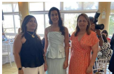
VI Premio Reconocimiento Andaluz a Carolina Marín