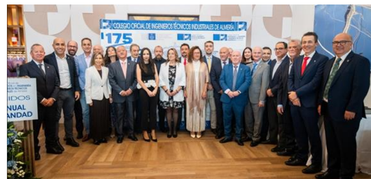
Acto Hermandad del Colegio Almería