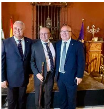
Toma posesión nueva Junta Gobierno COITI Sevilla