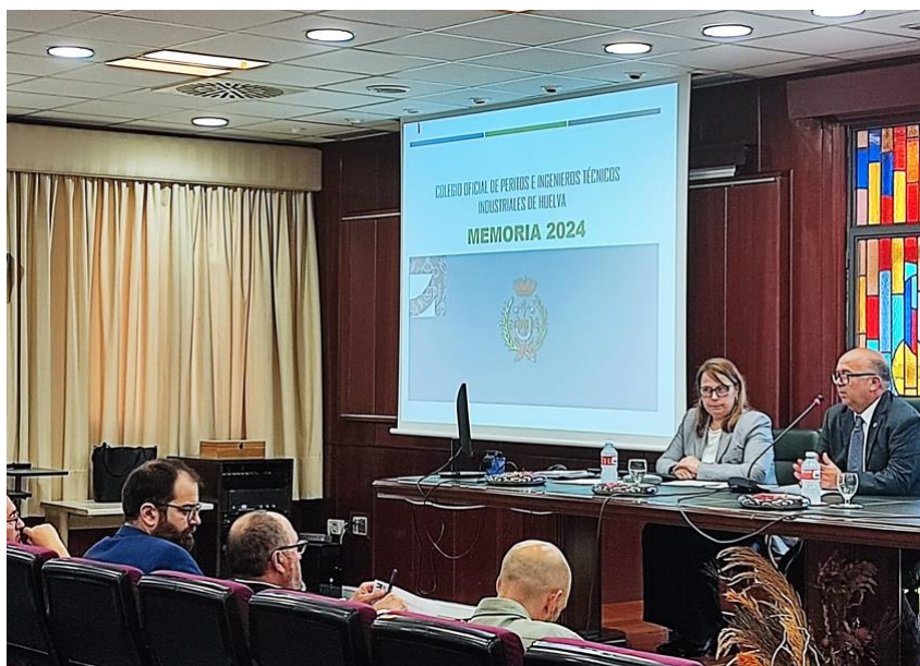
JUNTA GENERAL ORDINARIA